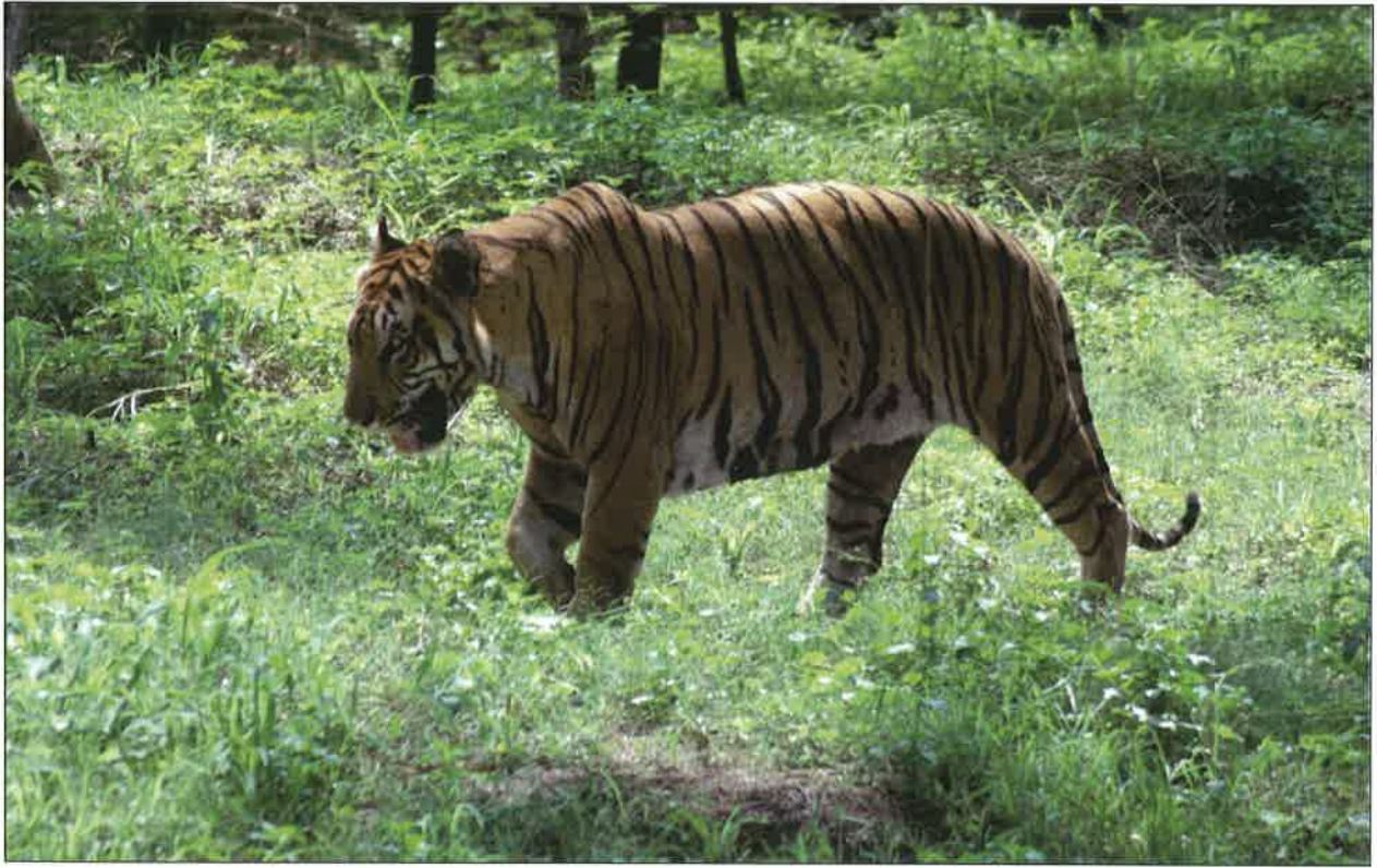
बाघ – लखनऊ चिड़ियाघर