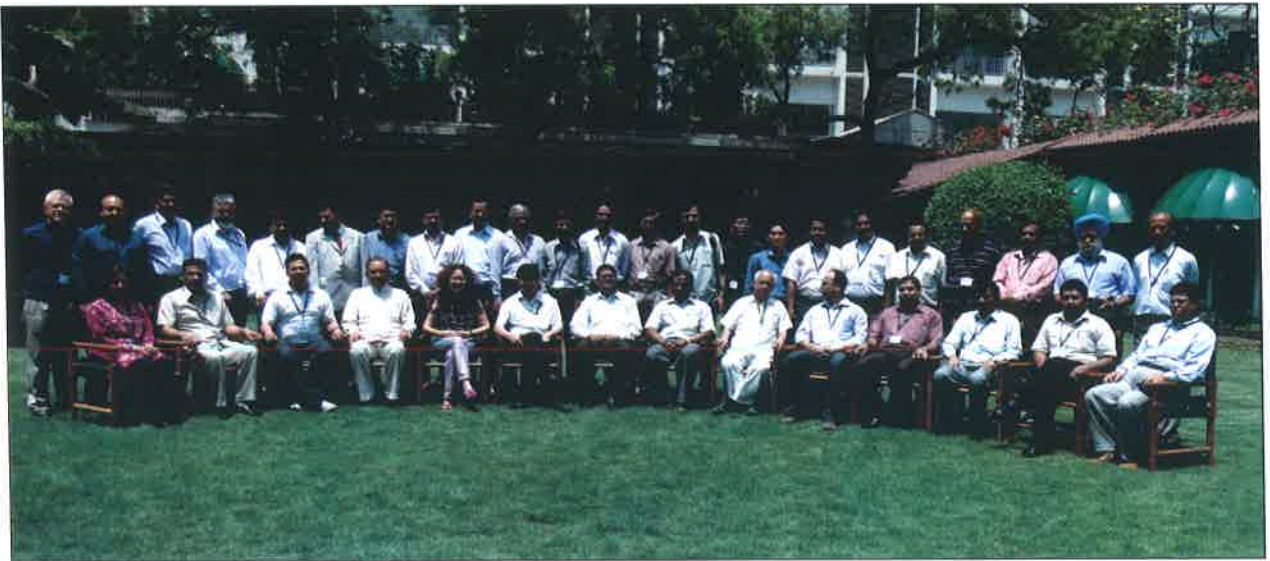
चिड़ियाघरों के डायरेक्टर्स की कार्यशाला - कोलकाता

5.1.2 "संरक्षण, विपणन, निधि संग्रहण एवं संसाधन प्रबंधन" विषय पर चिड़ियाघर निदेशकों के लिए कोलकाता में जूलोजिकल गार्डन, अलीपुर कोलकाता के सहयोग से 27-30 अप्रैल, 2010 तक एक कार्यशाला आयोजित की गई थी।