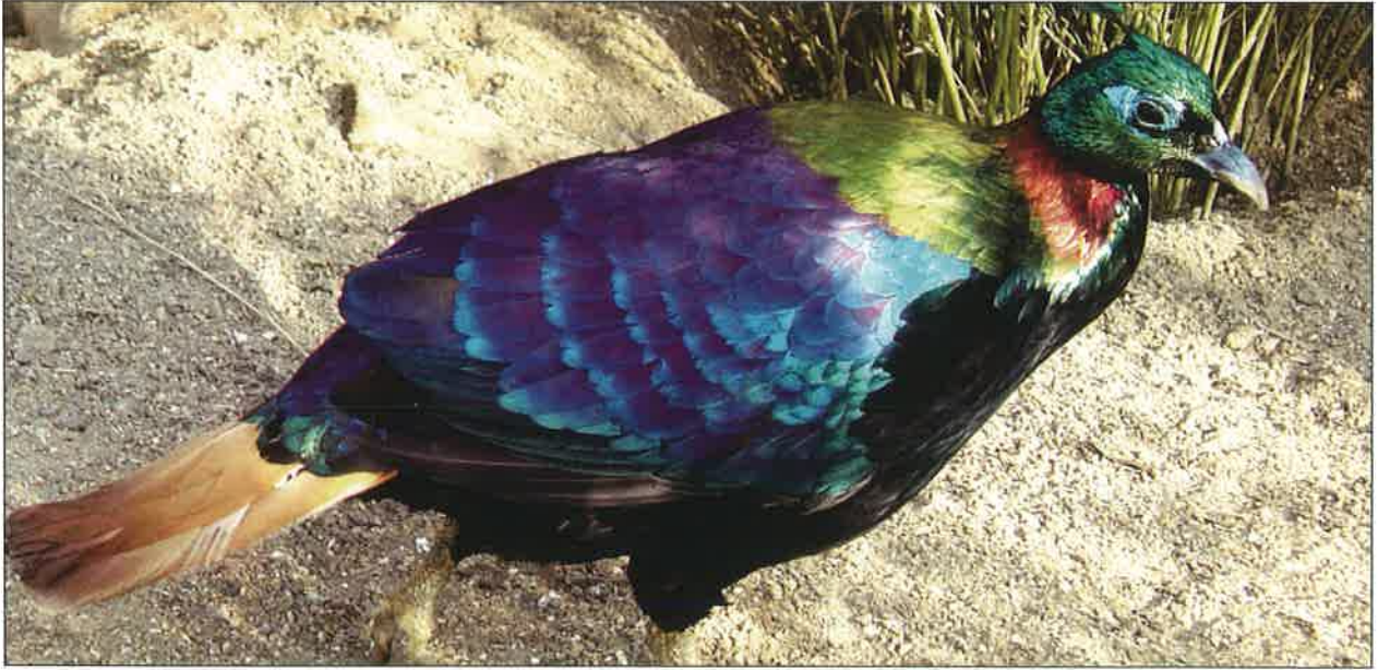
मोनाल- मनाली मिनी चिड़ियाघर

चिड़ियाघर में रखे गए हाथियों को उनके स्वास्थ्य, बड़े आकार के प्राकृतिक बाड़ों की उपलब्धता एवं संरक्षित क्षेत्रों में समुचित सुविधाओं के अभाव के आधार पर अंतरित करने में छूट के लिए मुख्य वन्यजीव रक्षक, चिड़ियाघर निदेशक से प्राप्त प्रस्तावों के जांच के लिए अतिरिक्त महानिदेशक वन (वन्यजीव), पर्यावरण एवं वन मंत्रालय, भारत सरकार तथा केन्द्रीय चिड़ियाघर प्राधिकरण की तकनीकी समिति के अध्यक्ष के अनुमोदन के साथ मूल्यांकन समिति को पुर्नगठित किया गया था। चिड़ियाघरों में से हाथियों को हाथी कैम्पों/पुनर्वास कैम्पों, राष्ट्रीय पार्कों, वन्यजीव संरक्षण क्षेत्र, बाघ रिजर्व आदि में वन विभाग के पास सुविधाओं में स्थानांतरित करने संबंधी केन्द्रीय चिड़ियाघर प्राधिकरण द्वारा 07 नवम्बर, 2009 को जारी दिशानिर्देश के संबंध में ऐसा किया गया था।