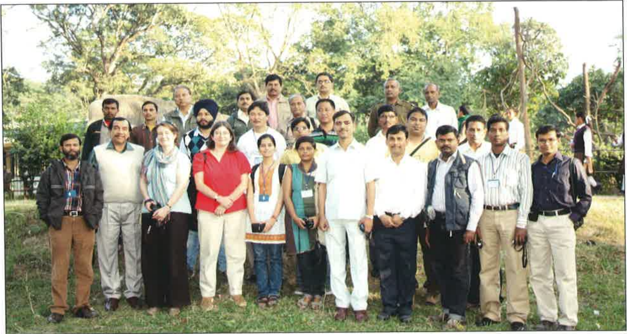
स्पाक सॉफ्टवेयर ट्रेनिंग के प्रशिक्षार्थी – गुवाहाटी

5.1.6 मद्रास पशुचिकित्सक कालेज तथा अरिगनार अन्न जूलोजिकल पार्क, चेन्नई के साथ सहयोग से “हिरण प्राणियों के विशेष संदर्भ में वन्य प्राणियों के परिवहन के दौरान वन्य प्राणियों की सुरक्षा एवं चिकित्सा देखरेख पर प्रोटोकाल ” विषय पर चिड़ियाघर पशु चिकित्सकों के लिए जनवरी 24से 28 तक एक प्रशिक्षण का कार्यक्रम आयोजित किया गया था ।