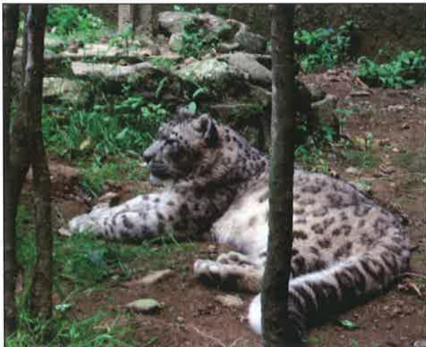
हिम तेंदुआ - पदमाजा नाएडु, हिमालयन जुलोजिकल पार्क, दार्जिलिंग