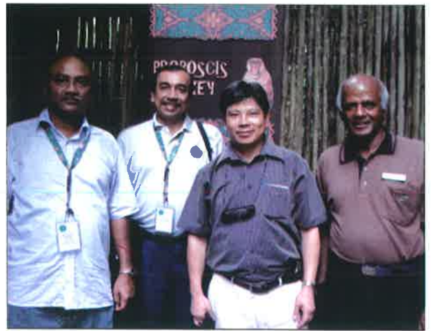
एनिमल इनरिचमेंट प्रशिक्षण कार्यक्रम में केन्द्रीय चिड़ियाघर प्राधिकरण के सदस्य सचिव के साथ अन्य भारतीय प्रशिक्षार्थी