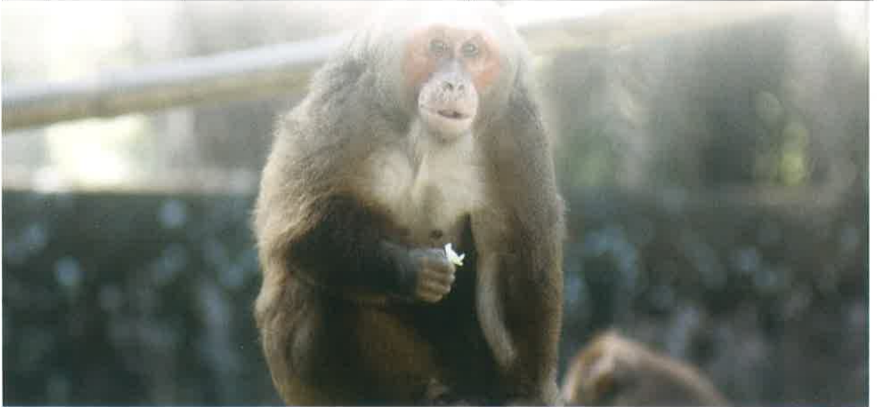
स्टम्प टेल मकाउ – आसाम स्टेट चिड़ियाघर, गुवाहाटी