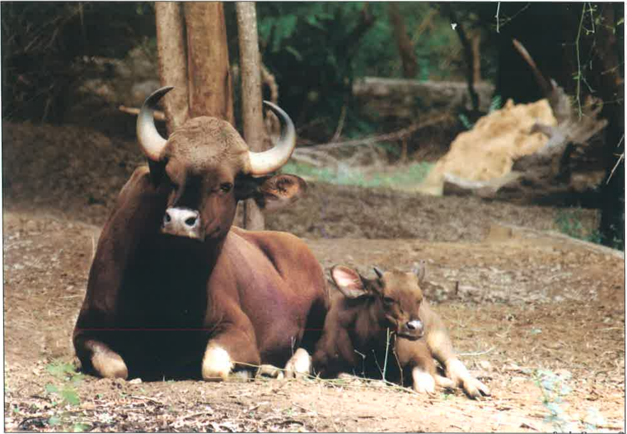
भारतीय गौर – अरिगनार अन्ना जूलोजिकल पार्क

केन्द्रीय चिड़ियाघर प्राधिकरण ने भारतीय चिड़ियाघरों में रखे गए स्लोथ बियर, हिमालयन ब्लैक बियर, ब्राउन बियर एवं मालयन सन बियर से संबंधित वंशावली तैयार करने तथा इसे अद्यतन करने के लिए वाइल्ड लाइफ एसओएस संस्था, नई दिल्ली को 17,76,144 रू के अनुदान को मंजूरी दी है और प्रथम वर्ष के दौरान 3.52 लाख रू0 जारी किए गए हैं।