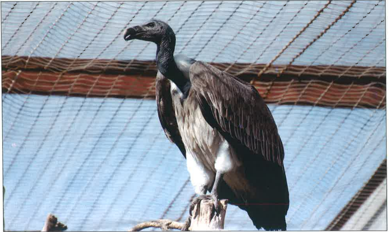
पतली चोंच वाला गिद्ध – वीसीवीसी, पिंजौर

केन्द्रीय चिड़ियाघर प्राधिकरण ने अंतर्राष्ट्रीय वन्य प्राणी सूचना प्रणाली (आईएसआईएस) को 57 प्रमुख चिड़ियाघरों में तथा 4 संबंधित संगठनों में साफ्टवेयर के उपयोग के लिए सदस्यता के प्रायोजकत्व हेतु 34,260.68 यूए डॉलर की राशि अग्रिम के तौर पर वर्ष 2010 में जारी की थी।