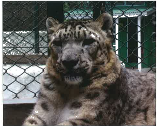
हिम तेंदुआ

केन्द्रीय चिड़ियाघर प्राधिकरण की दृष्टि देश की जैव विविधता के संरक्षण की दिशा में देश में हो रहे प्रयासों को सहयोग प्रदान करना और सुदृढ़ करना है। खासतौर पर संरक्षण के साथ उत्कृष्ट परम्परा के जरिए वन्य जीव को समृद्ध करना है।