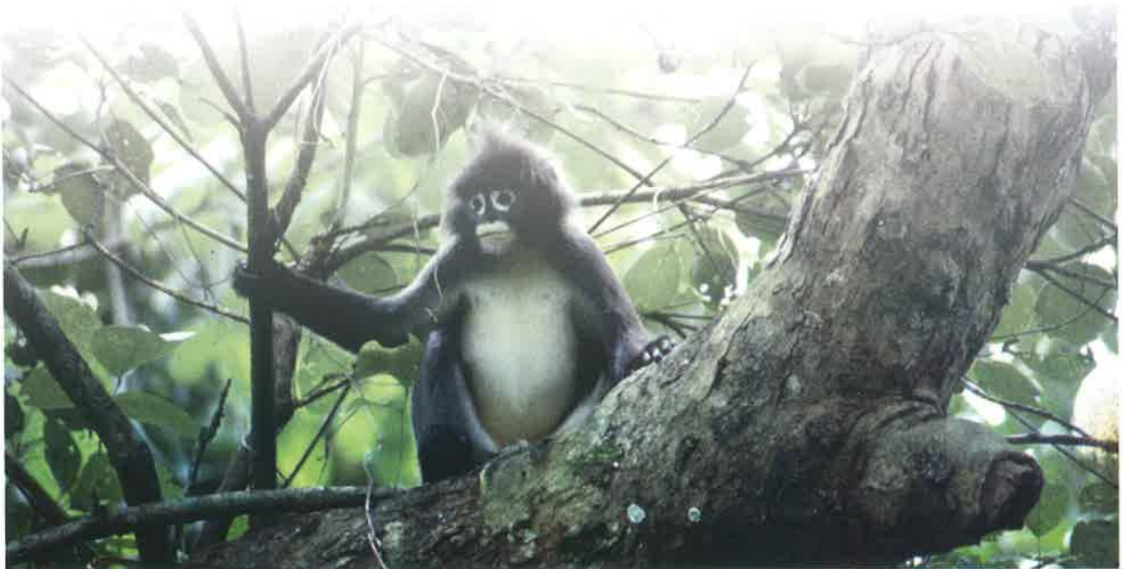
चश्मीश बन्दर

केन्द्रीय चिड़ियाघर प्राधिकरण की चिड़ियाघर डिजाइन संबंधी विशेषज्ञ समूह की 14वीं, 15वीं, 16वीं एवं 17वीं, 18वीं, 19वीं, 20वीं बैठक क्रमशः 05 अप्रैल, 26 अप्रैल, 17 जून, 09 अगस्त, 18 दिसम्बर, 2010 तथा 01 फरवरी, 2011 एवं 16 मार्च, 2011 को आयोजित की गई थी। चिड़ियाघर के मास्टर प्लान/मास्टर लेआउट प्लान की जांच में तेजी लाने और चार विभिन्न क्षेत्रों के चिड़ियाघरों के मास्टर प्लान की निगरानी के लिए विशेषज्ञ समूह को चार उप-समूहों में बांट दिया गया था।