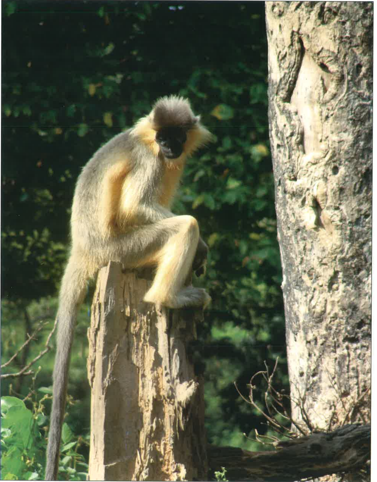
टोपी वाला लंगूर – सिपाहीझाला चिड़ियाघर