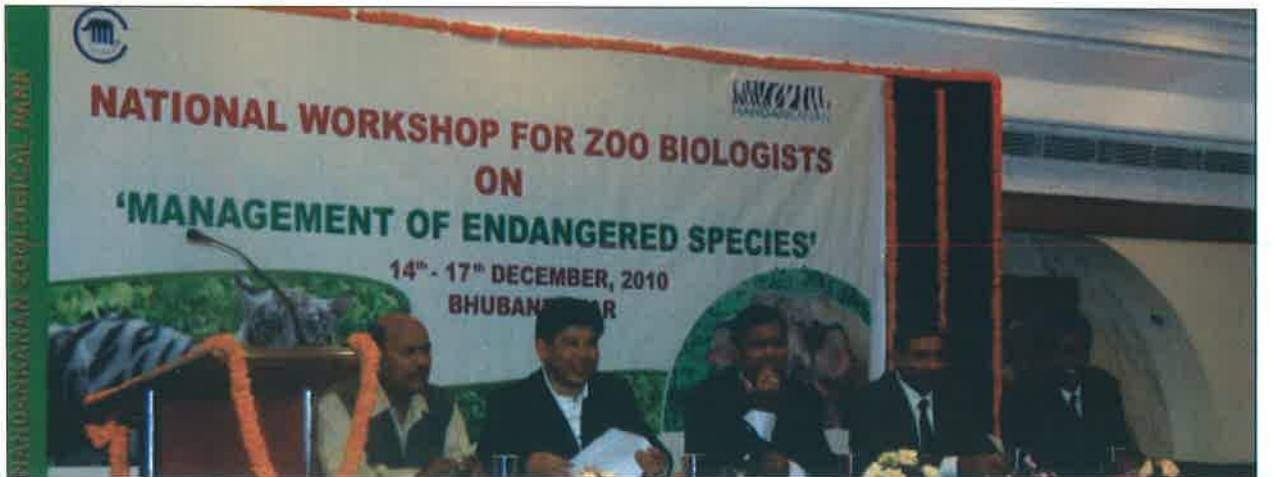
बायोलोजिस्ट कार्यक्रम – ओडिशा

5.1.5 नंदनकानन जूलोजिकल पार्क, भुवनेश्वर के सहयोग से 14 से 17 दिसम्बर, 2010 के दौरान भुवनेश्वर में "विलुप्त प्रजाति प्रबंधन" विषय पर चिड़ियाघर बायोलोजिस्ट के लिए एक कार्यशाला आयोजित की गई थी।