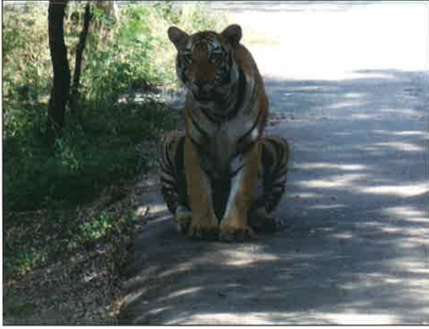
भारतीय बाघ - नेहरू जुलोजिकल पार्क, हैदराबाद