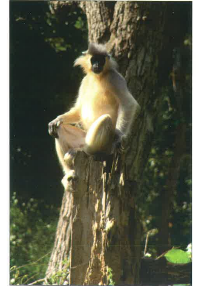
टोपी वाला लंगूर – सिपाहीझाला चिड़ियाघर