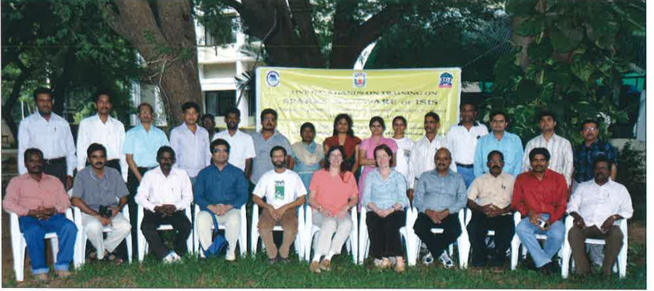
स्पार्क सॉफ्टवेयर ट्रेनिंग के प्रशिक्षार्थी – चैन्नई

5.1.3 केन्द्रीय चिड़ियाघर प्राधिकरण ने राष्ट्रीय वन्य प्राणी कल्याण संस्थान, वल्लभगढ़ के सहयोग से "चिड़ियाघर में वन्य प्राणी कल्याण के विभिन्न पक्षों" विषय पर एक प्रशिक्षण कार्यक्रम 28 जून से 2 जुलाई, 2010 तक बल्लभगढ़ के चिड़ियाघरों में कर्मचारियों के लिए आयोजित किया गया था।