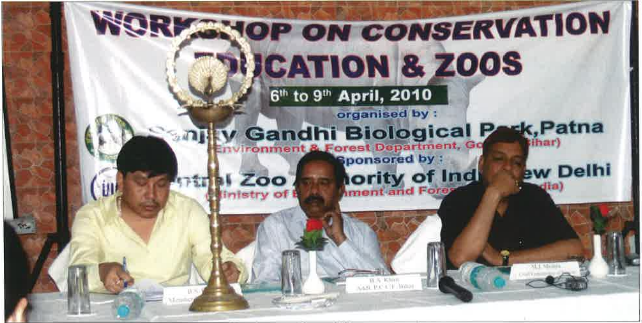
वन्यजीव संरक्षण पर शिक्षा व चिड़ियाघर पर कार्यशाला - पटना

5.1.1 केन्द्रीय चिड़ियाघर प्राधिकरण ने संजय गांधी बायोलॉजिकल पार्क, पटना के सहयोग में अप्रैल 6-9, 2010 के दौरान पटना चिड़ियाघर में कार्य कर रहे शिक्षाविदों को "संरक्षण शिक्षा एवं चिड़ियाघर" विषय पर एक कार्यशाला आयोजित की थी।